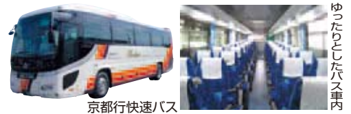
京都市行快速バス

注 間人発 7時25分 朝1便のみ野田川駅～岩滝間は経由いたしません。○は乗換可能な便もあります。 洛西ニュータウン北口～京都駅間は、上りは降車のみ、下りは乗車のみとなります。 ※停留所ではパーク＆ライドが可能です。